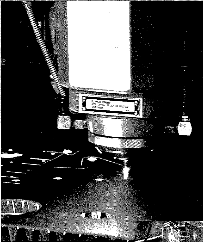
高出力ファイバーレーザーによるチタン切断のもよう